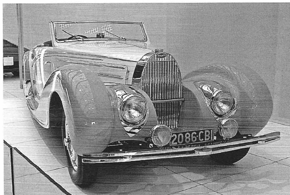
Unser Bilderreigen könnte unter dem Motto stehen „Auch andere Mütter haben schöne Töchter“: Cord 812 Beverly Sedan, Bugatti 57 Spider, Ferrari 250 GTO und Maserati 6C34